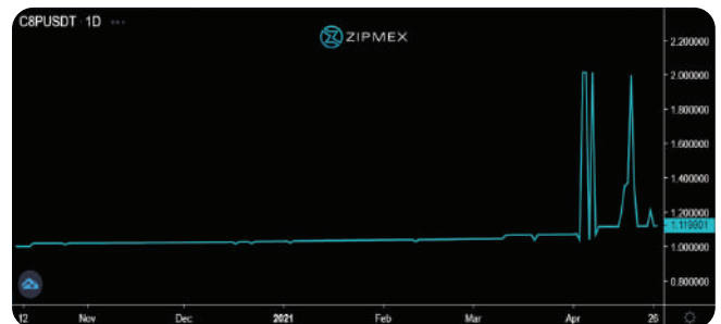
จากภาพแสดงถึงการเปลี่ยนแปลงของราคาในช่วงระยะเวลาตั้งแต่ปี 2020 - 22 เม.ย. 2021