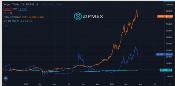
กราฟการเคลื่อนไหวของราคา เปรียบเทียบราคาเหรียญ SXP, Total Market Cap และ SET Index

จากภาพแสดงถึงการเปลี่ยนแปลงของราคา ในช่วงระยะเวลาตั้งแต่ปี 2019 - วันที่ 21 เม.ย. 2021