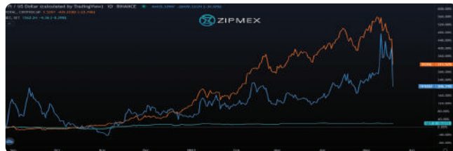
ราคา YFI ราคา Total Market Cap Set Index จากภาพแสดงถึงการเปลี่ยนแปลงของราคาในช่วงระยะเวลาตั้งแต่ปี 2020 - 19 พ.ค. 2021